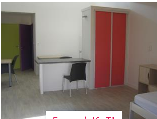
Espace de Vie T1