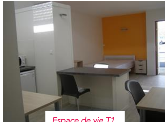
Espace de vie T1