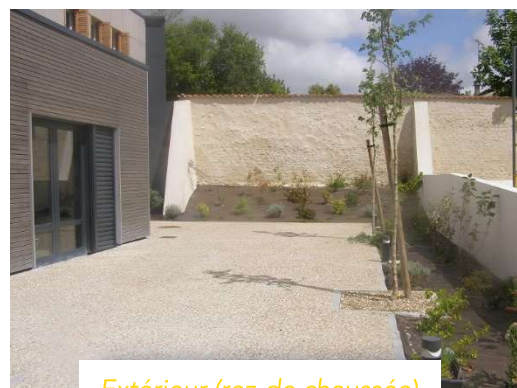
Extérieur (rez-de chaussée)