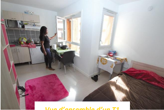
Vue d'ensemble d'un T1