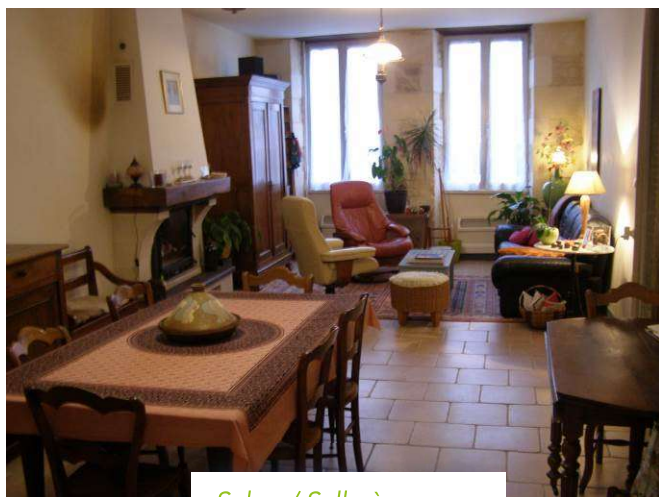
Salon / Salle à manger