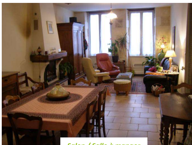
Salon / Salle à manger