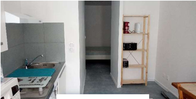
Salon / Salle à manger