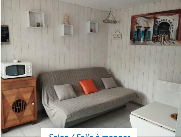
Salon / Salle à manger