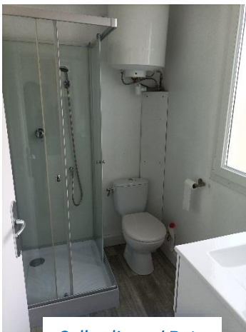
Salle d'eau / Bain