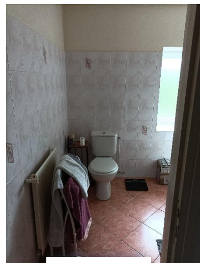
WC 1 er étage