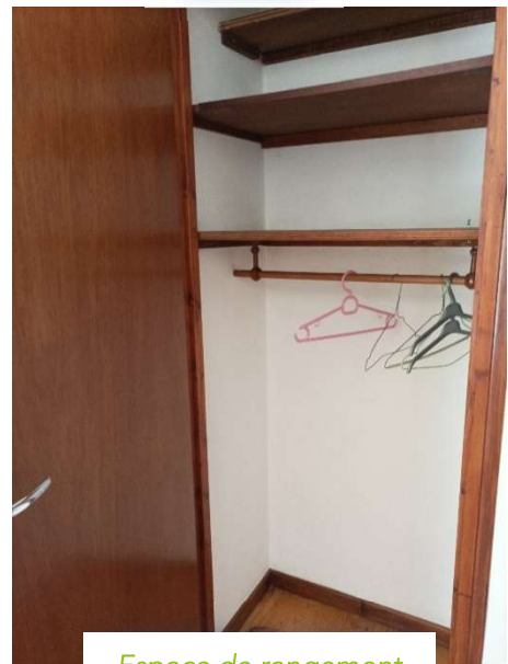
Espace de rangement