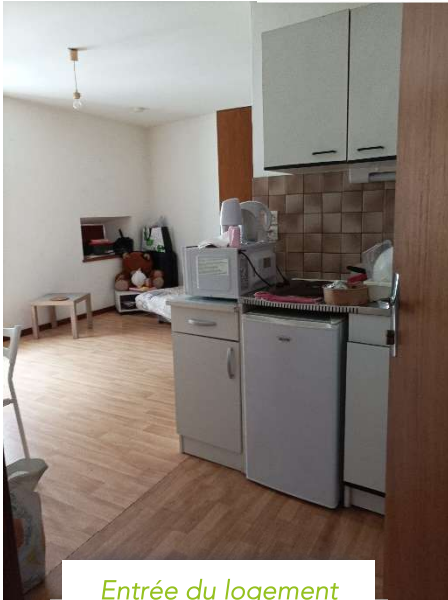
Entrée du logement