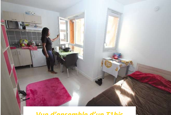
Vue d'ensemble d'un T1bis