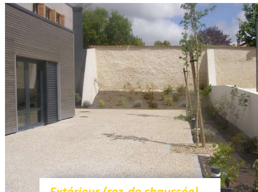
Extérieur (rez-de chaussée)