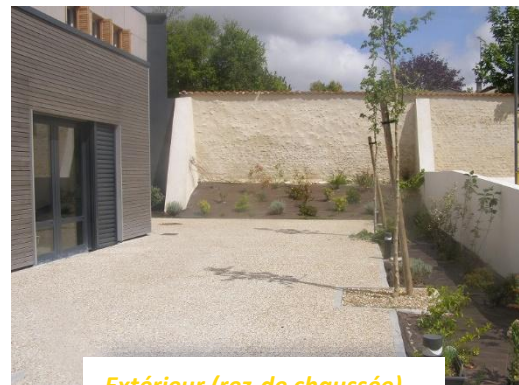
Extérieur (rez-de chaussée)