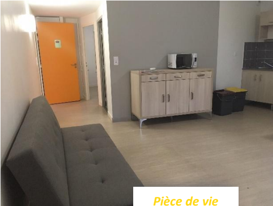
Pièce de vie