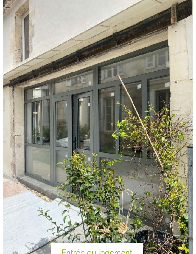
Entrée du logement