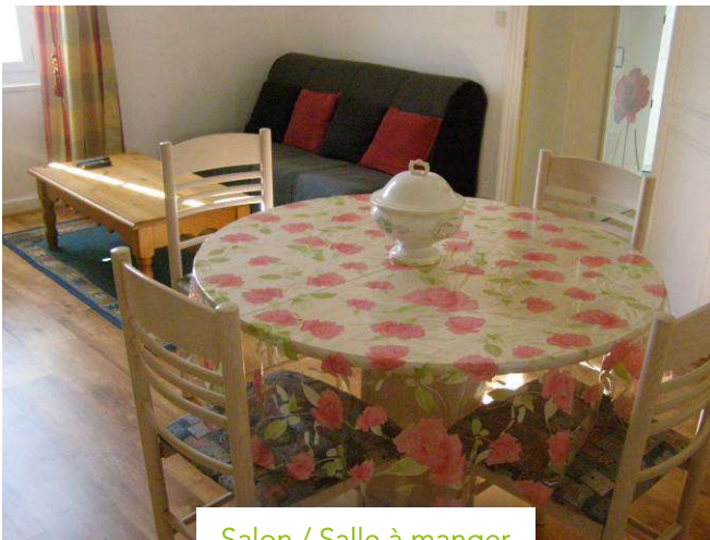
Salon / Salle à manger