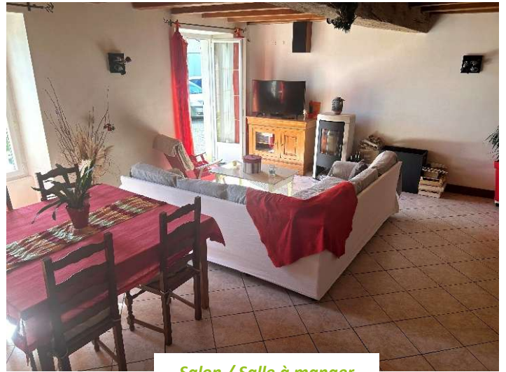
Salon / Salle à manger