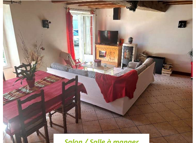
Salon / Salle à manger