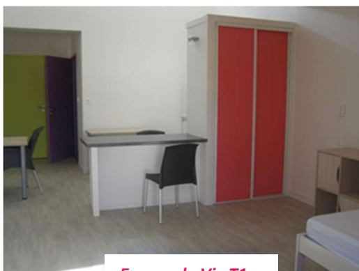
Espace de Vie T1