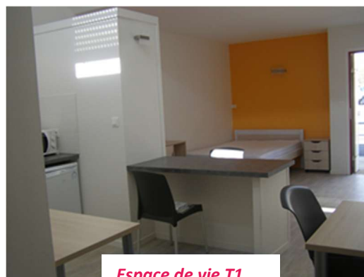
Espace de vie T1